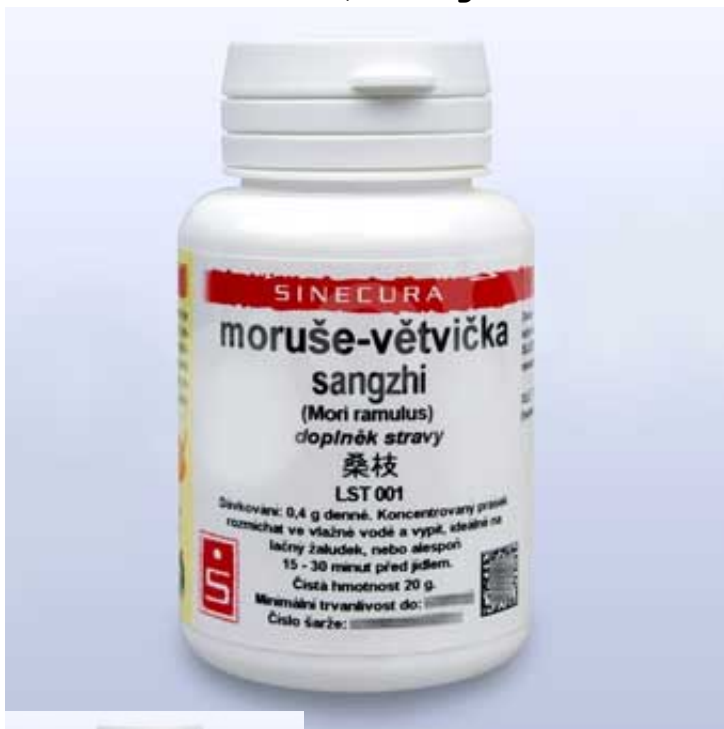
moruse vetvicka instantni prasek