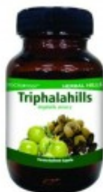
triphalahills 60 kapsli

Trávení a imunitní systém, ovlivňuje kardiovaskulární zdraví, hladinu cholesterolu a cukru v krvi, játra a respirační zdraví.