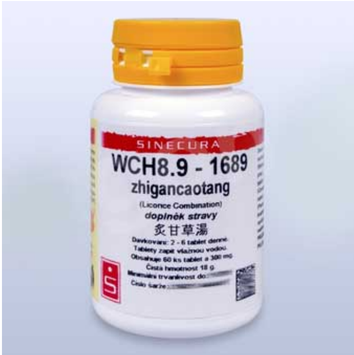
WCH8.9-1689 zhigancaotang pian